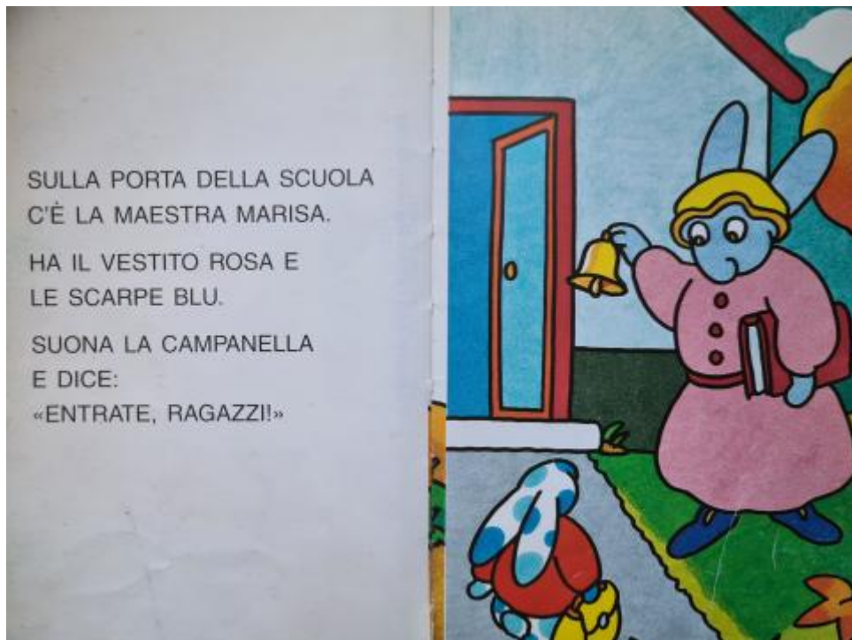
F. Altan, Illustrazione senza titolo, in Id., Coniglietto torna a scuola, Trieste, Emme Edizioni, 1997, p.n.n.