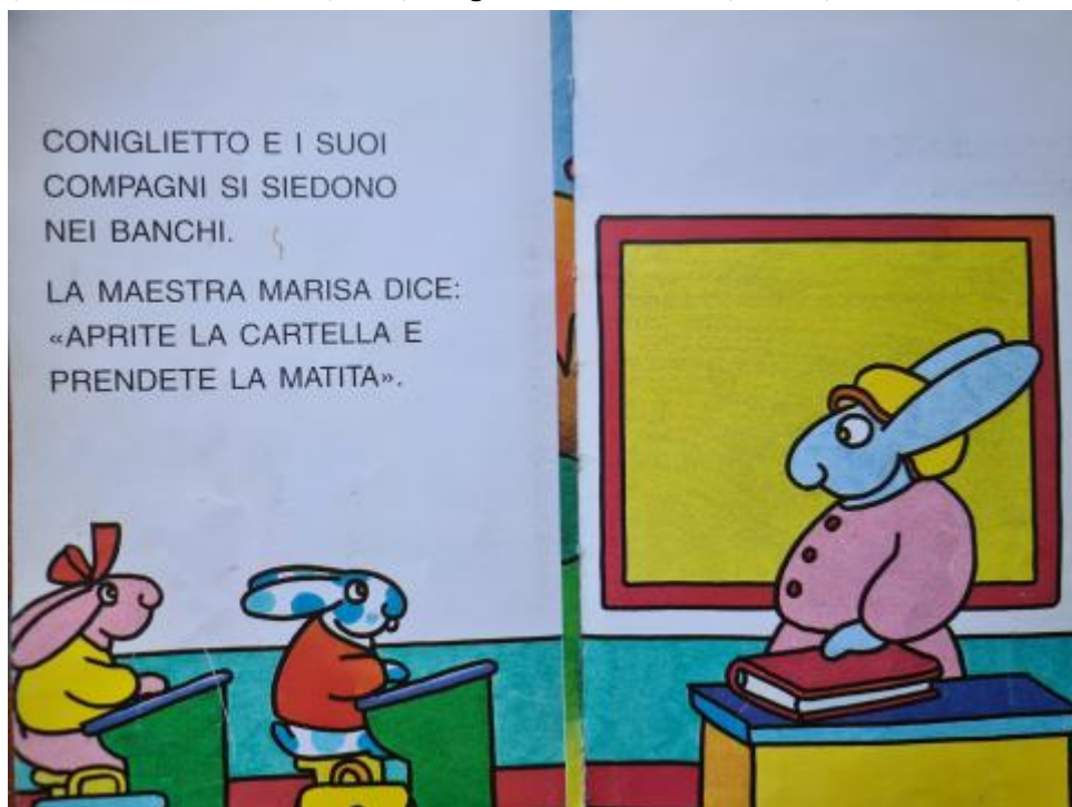
F. Altan, Illustrazione senza titolo, in Id., Coniglietto torna a scuola, Trieste, Emme Edizioni, 1997, p.n.n.