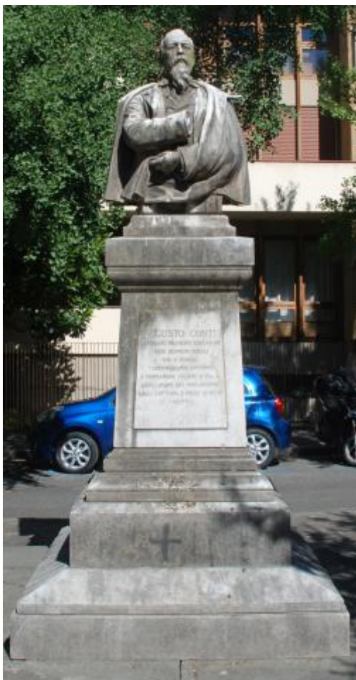
1) Foto del busto con epigrafe ad Augusto Conti a Firenze