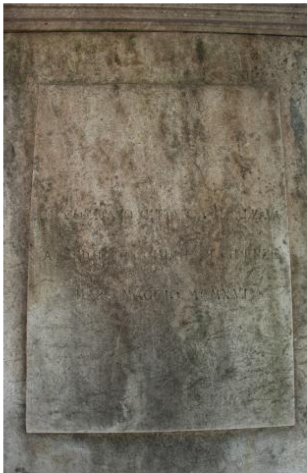
4) Foto di dettaglio dell'epigrafe a tergo