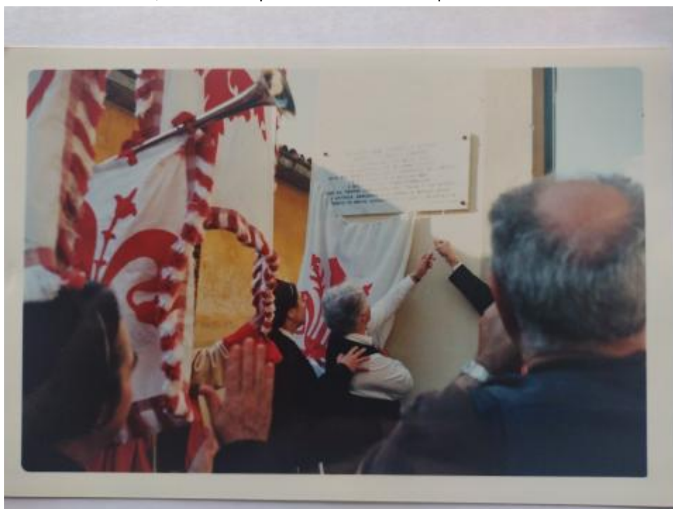
2) Foto della cerimonia di svelamento della lapide