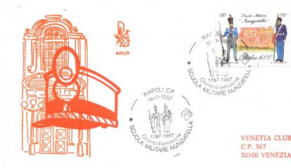
FIG. 3 - First day cover, emittente Venetia, annullo filatelico primo giorno Napoli, non viaggiata. CpB