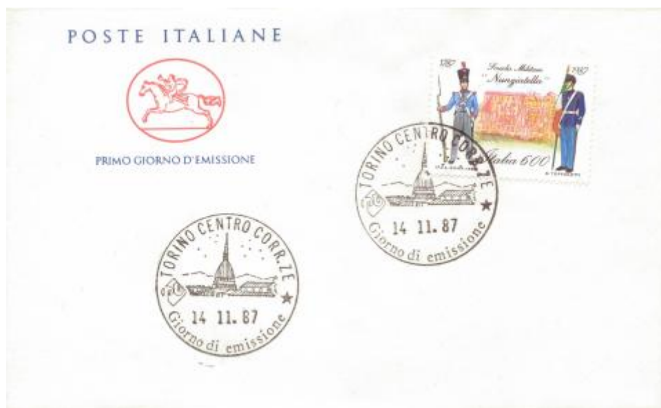
FIG. 2 - Cavallino, emittente Poste italiane, annullo primo giorno Torino centro, non viaggiato. CpB