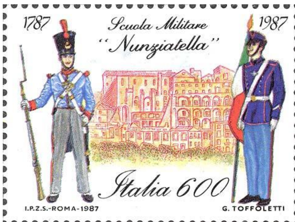
FIG. 1 - Francobollo celebrativo della Scuola Militare Nunziatella nel secondo centenario della sua fondazione