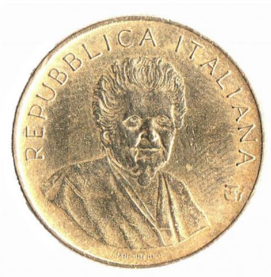
1) Foto del diritto della moneta commemorativa di Maria Montessori (ritaglio dell'originale)